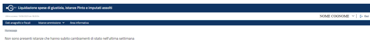
Figura 1 Home page

Per accedere all'applicativo l'utente deve essere registrato come avvocato nel registro ReGIndE dell'Amministrazione. Il controllo verrà effettuato alla selezione dell'icona di Istanza patrocinio stragiudiziale e, in caso di controllo non superato, verrà visualizzato un apposito messaggio all'utente: "L'utente non possiede i permessi per accedere"; viceversa, l'utente verrà indirizzato alla Home Page personalizzata di Istanza patrocinio stragiudiziale .